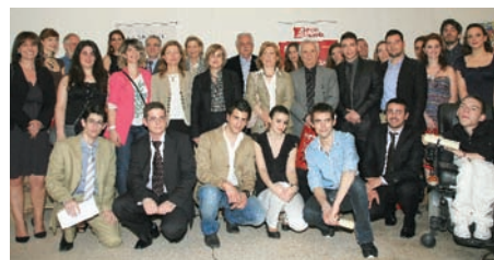
Τελετή απονομής των βραβείων: Μάιος 2011